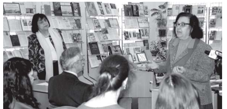
собор и рабочий момент конференции.